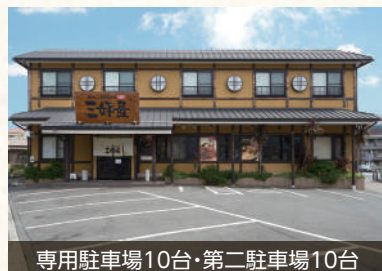
専用駐車場10台・第二駐車場10台

ご予約・お問合せ TEL 0465-74-0220 〒250-0122 神奈川県南足柄市飯沢4-1 営業時間 [昼] 11:00~14:30(LO13:50) [夜] 17:00~22:00(LO21:00) 定休日 月曜日(祝日の場合は翌火曜)・年末年始 席数 126席 釜めし 三好屋