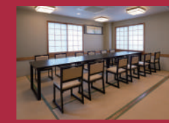
高座機・テーブルも をご用意しています