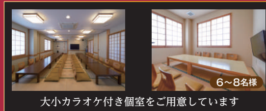
大小カラオケ付き個室をご用意しています