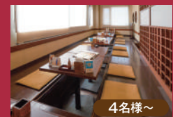
小上がり堀こたつ席